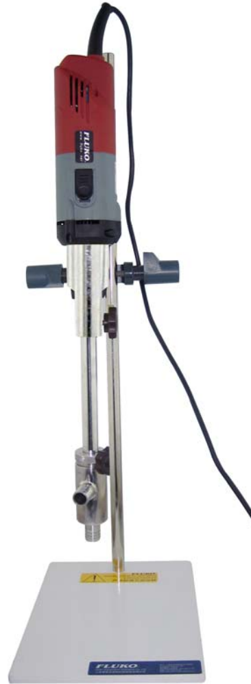
F22Z 型 实验室高剪切分散乳化机